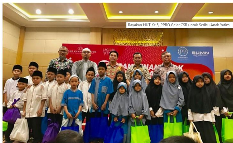
jajaran direksi bersama anak yatim pada acara santunan, Foto: PPRO for INDOPOS

INDOPOS.CO.ID - PT PP Properti (PPRO) mencatat rekam jejak gemilang dengan bertahan di industri property dari setiap perjalanan perkembangan hingga berada di usia lima tahun. Seiring perayaan ulang tahun ke 5, sebagai bentuk Corporate Social Responsibility (CSR) di ruang lingkup sekitar perusahaan, PPRO mengadakan syukuran dan santunan untuk anak yatim dari yayasan sekitar Bekasi dan Pasar Rebo.